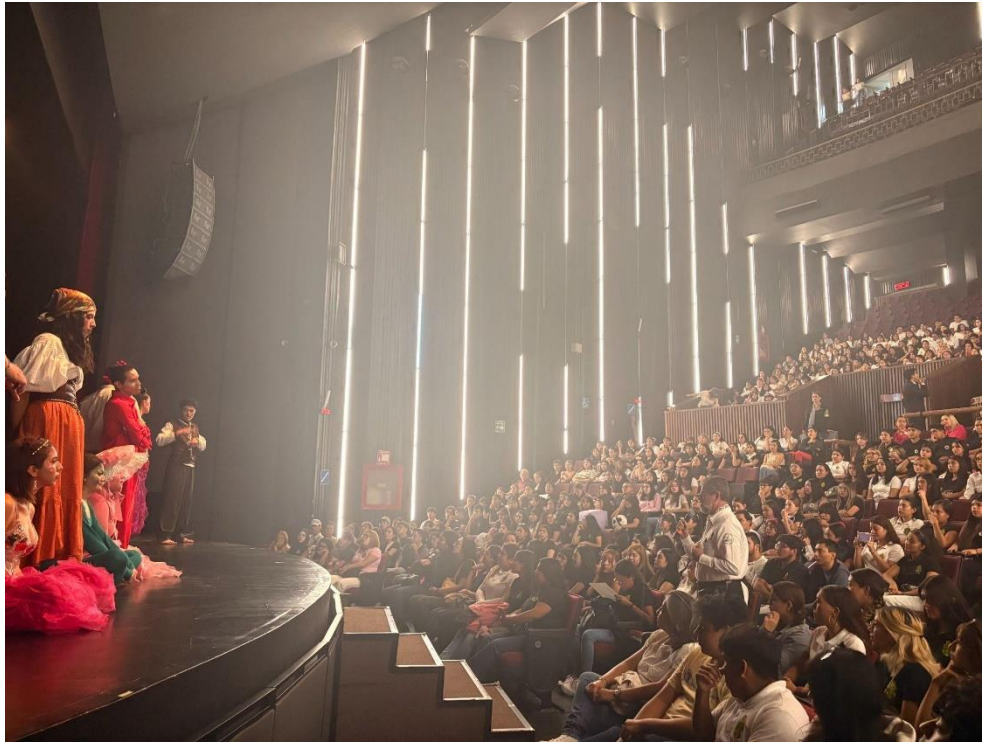
Figura 4. Fotografía de una charla después de una función, entre futuros docentes de la Escuela Normal Oficial de León y el elenco de enSEÑAtetaro . Se platicó sobre la importancia de la inclusión en las aulas educativas y la apertura de brindar los espacios adecuados para la enseñanza de la Lengua de Señas Mexicana y el teatro como disciplina artística que lo facilita. Viernes 21 de marzo de 2025.