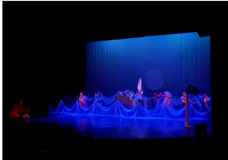
Figura 2. Puesta en escena con iluminación completa durante la función 30 de la temporada 2025 como parte del programa Teatro Escolar León, Guanajuato.